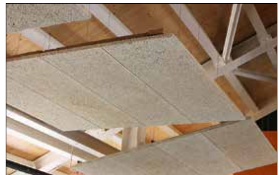
CELENIT Holzwolle Akustikplatten – die Akustikdämmung für alle Baubereiche