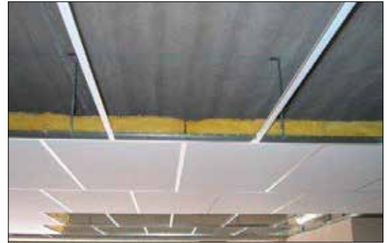
ABAKUS „white light“ abgehängte Tiefgaragendeckendämmung