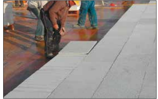
Protolith Tiefgaragendeckendämmung zum Mitbetonieren und zur nachträglichen Befestigung