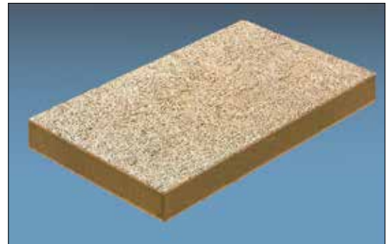
CELENIT Holzwolle Mehrschichtplatten – die Tiefgaragendeckendämmung zum Mitbetonieren und zur nachträglichen Befestigung